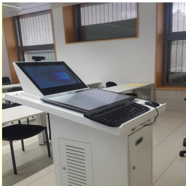
Figura 2. Monitor táctil SMART integrado en Aula de Postgrado.

Los estudiantes que sigan la docencia presencial, verán proyectados los contenidos del monitor táctil en la/las pantalla/s del aula. Los estudiantes que estén conectados en remoto verán en su ordenador estos contenidos junto con la imagen del profesor obtenida desde una cámara web que se sitúa encima del segundo monitor, de manera que la interacción entre profesorado y estudiantes es adecuada y permite la participación activa de estos últimos.