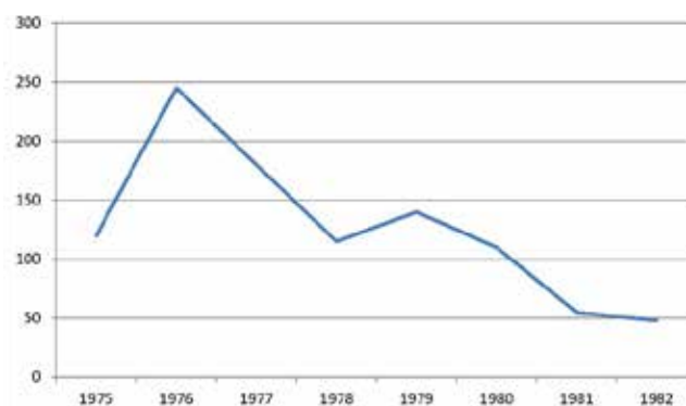
GRÁFICO 2. Evolución cronológica anual de víctimas asesinadas por violencia de la extrema derecha

Fuente: BABY, SOPHIE. El mito de la transición pacífica .