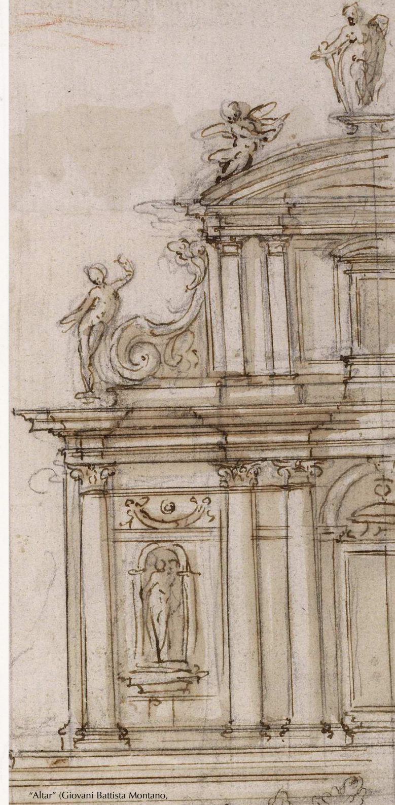
"Altar" (Giovanni Battista Montano,